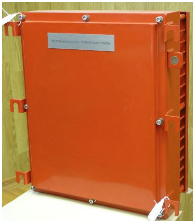
Рисунок 2 – АПНК. Аппаратный отсек с установленной крышкой