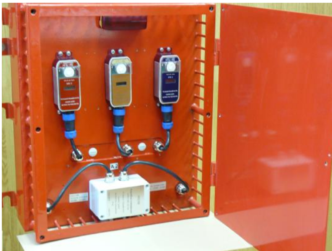
Рисунок 3 – АПНК. Отсек датчиков с открытой крышкой