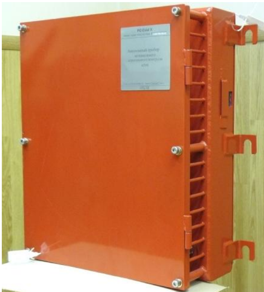
Рисунок 4 – АПНК. Отсек датчиков с закрытой крышкой

Ввод питания и вывод информационных сигналов осуществляется через кабельные вводы коробки клеммной, расположенной в отделении датчиков.