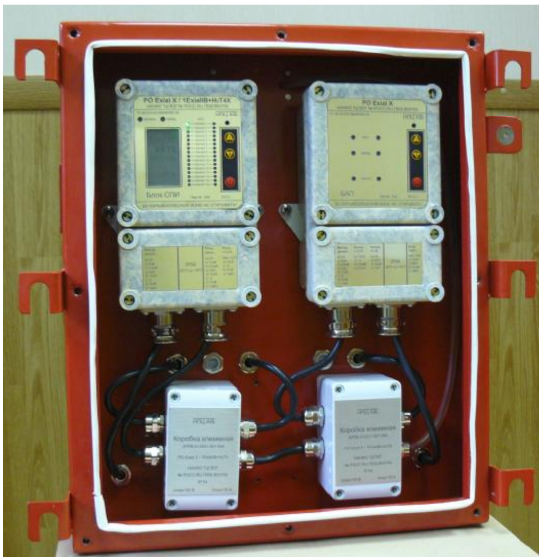
Рисунок 1 – АПНК. Аппаратный отсек со снятой крышкой